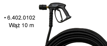
• 6.402.0102 Wąż 10 m